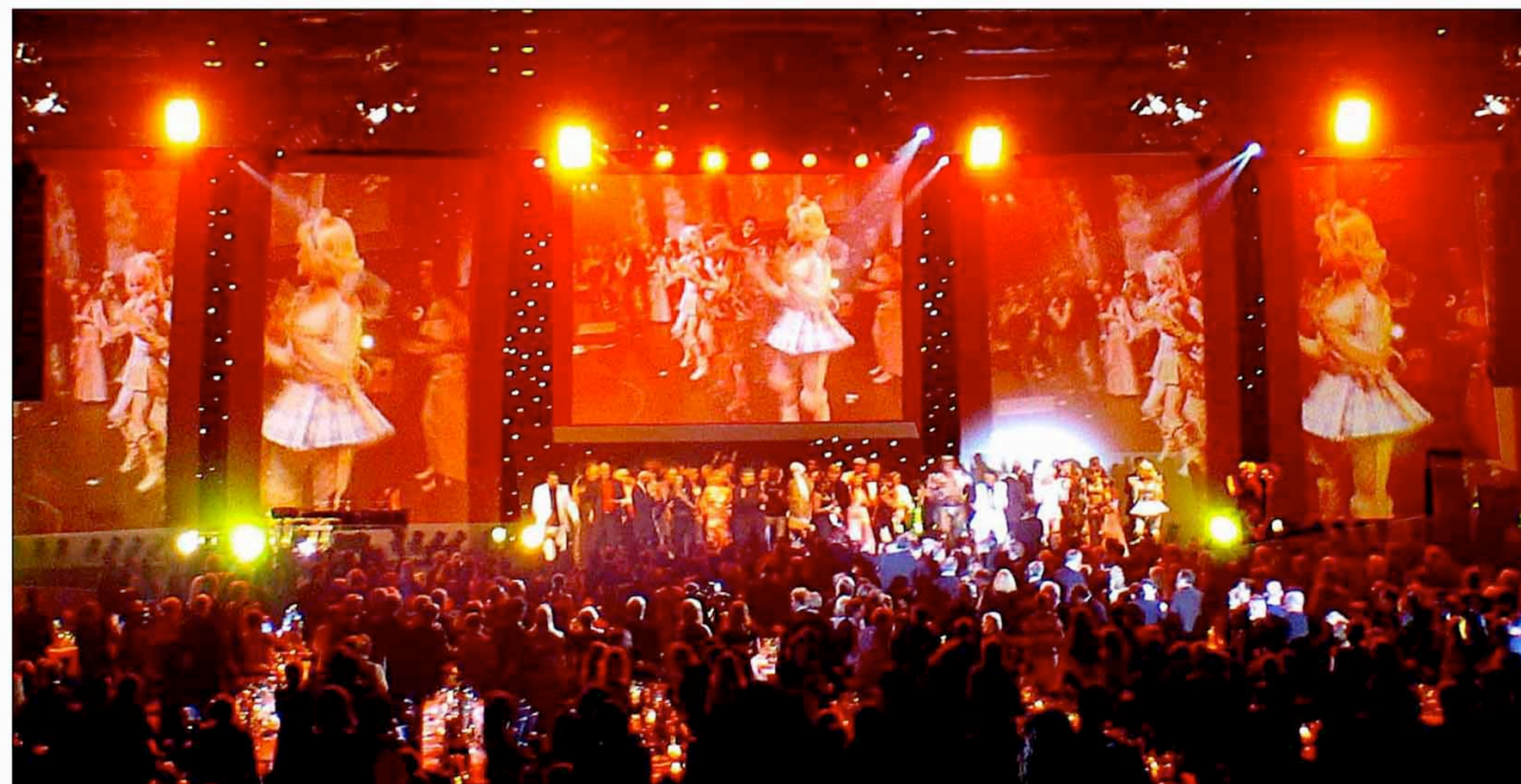
Auch optisch ein gigantisches Erlebnis war die Verleihung der baden-württembergischen Medienpreise in Karlsruhe, in Szene gesetzt vom Schramberger Video-Regisseur Heinz Ruess.

schon allerhand gesehen hat, war der Aufmarsch beim achten Medienpreis Baden-Württemberg auch für ihn ein außergewöhnliches Ereignis.