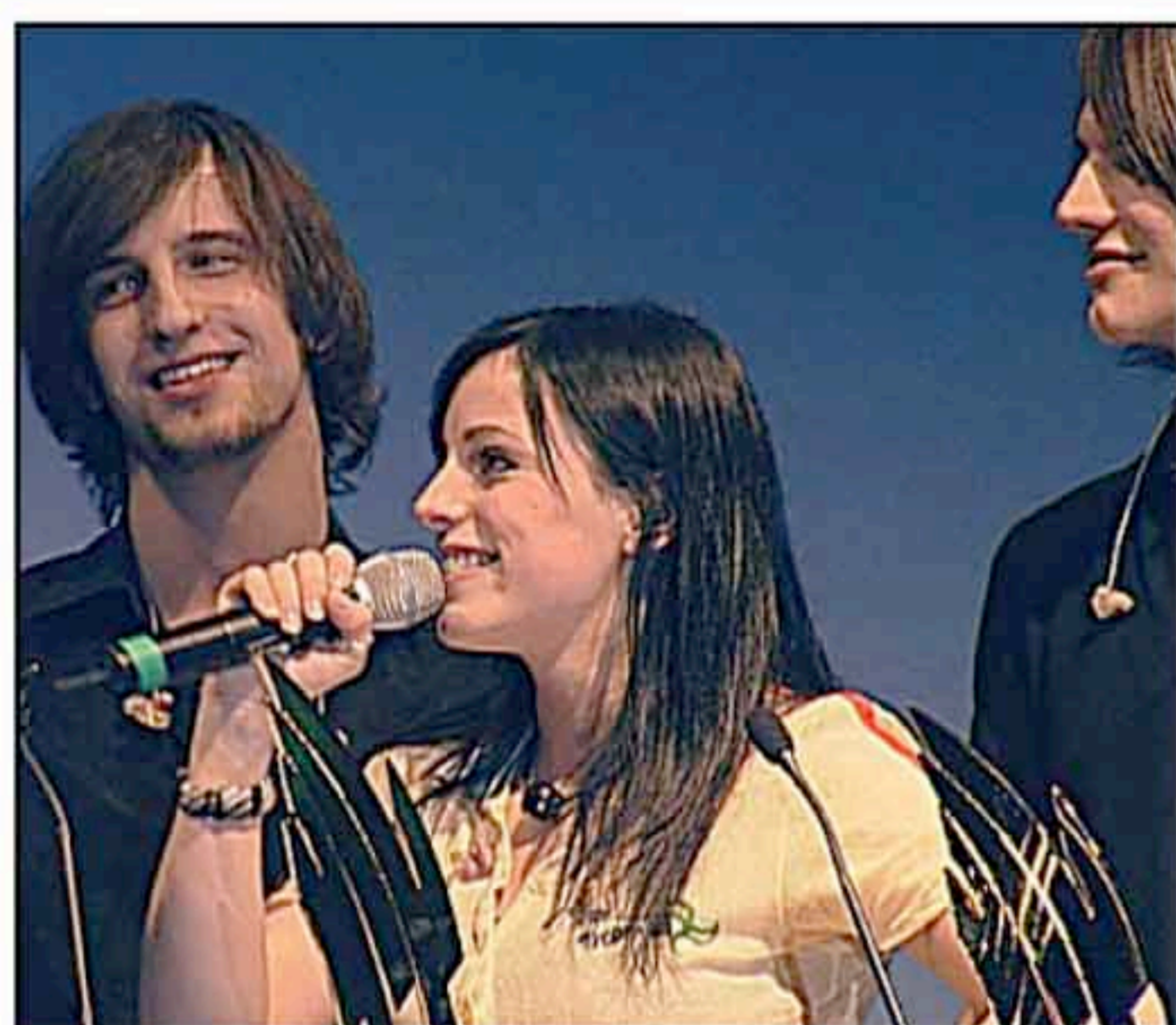
Die Newcomer 2004, »Silbermond«, auf der Videoleinwand.

17 prominente Preisträger und ihre nicht minder bekannten Laudatoren ließen sich von 1700 Gästen in Karlsruhe in